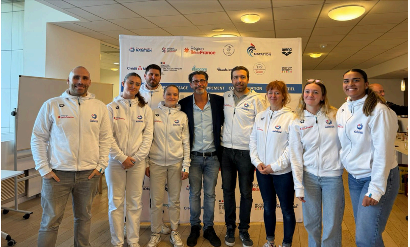
Photo des salariés de la Ligue Ile-de-France de Natation lors de l'Assemblée Générale du samedi 12 octobre 2024 :